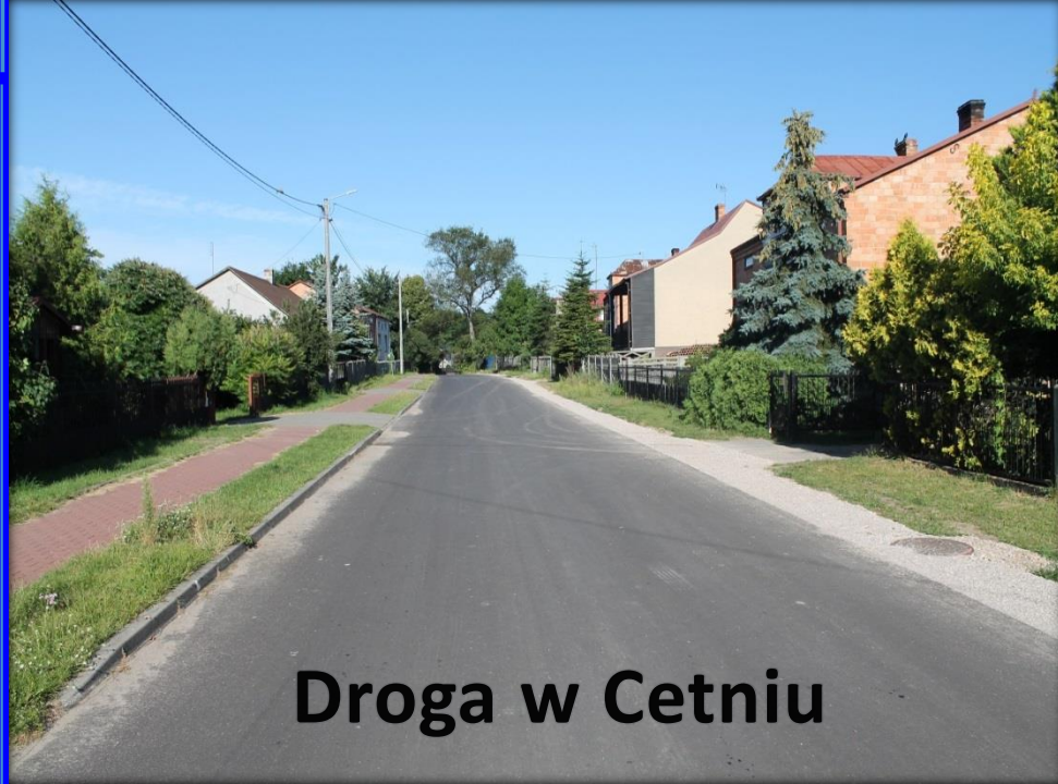
Droga w Cetniu