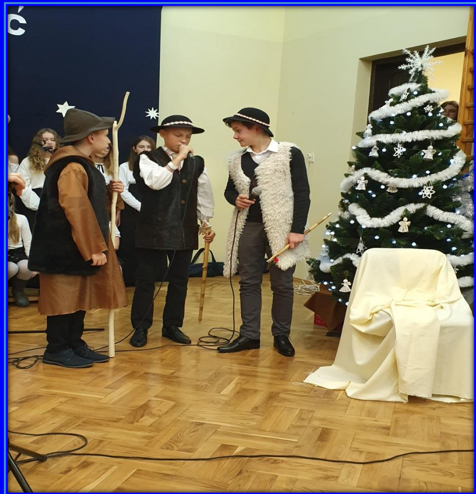
Inscenizacja bożonarodzeniowa w wykonaniu uczniów z PSP w Odrzywole