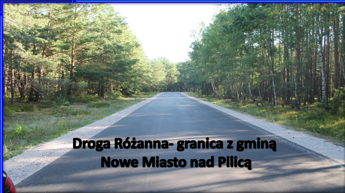
Droga Różanna- granica z gminą Nowe Miasto nad Pilicą