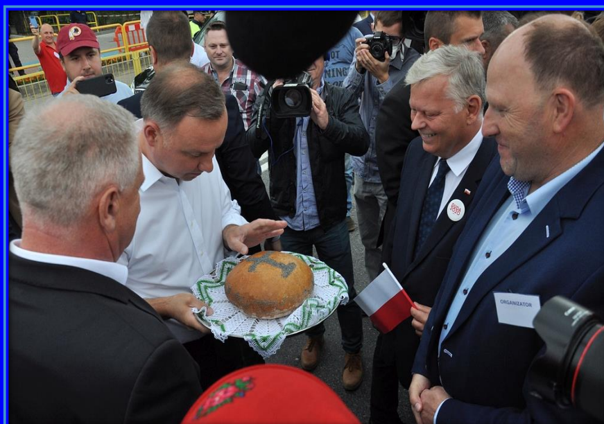
Prezydent Andrzej Duda - spotkanie powyborcze