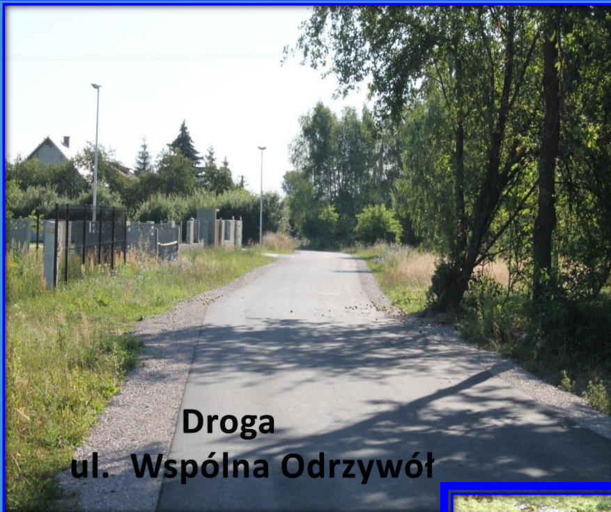
Droga ul. Wspólna Odrzywół