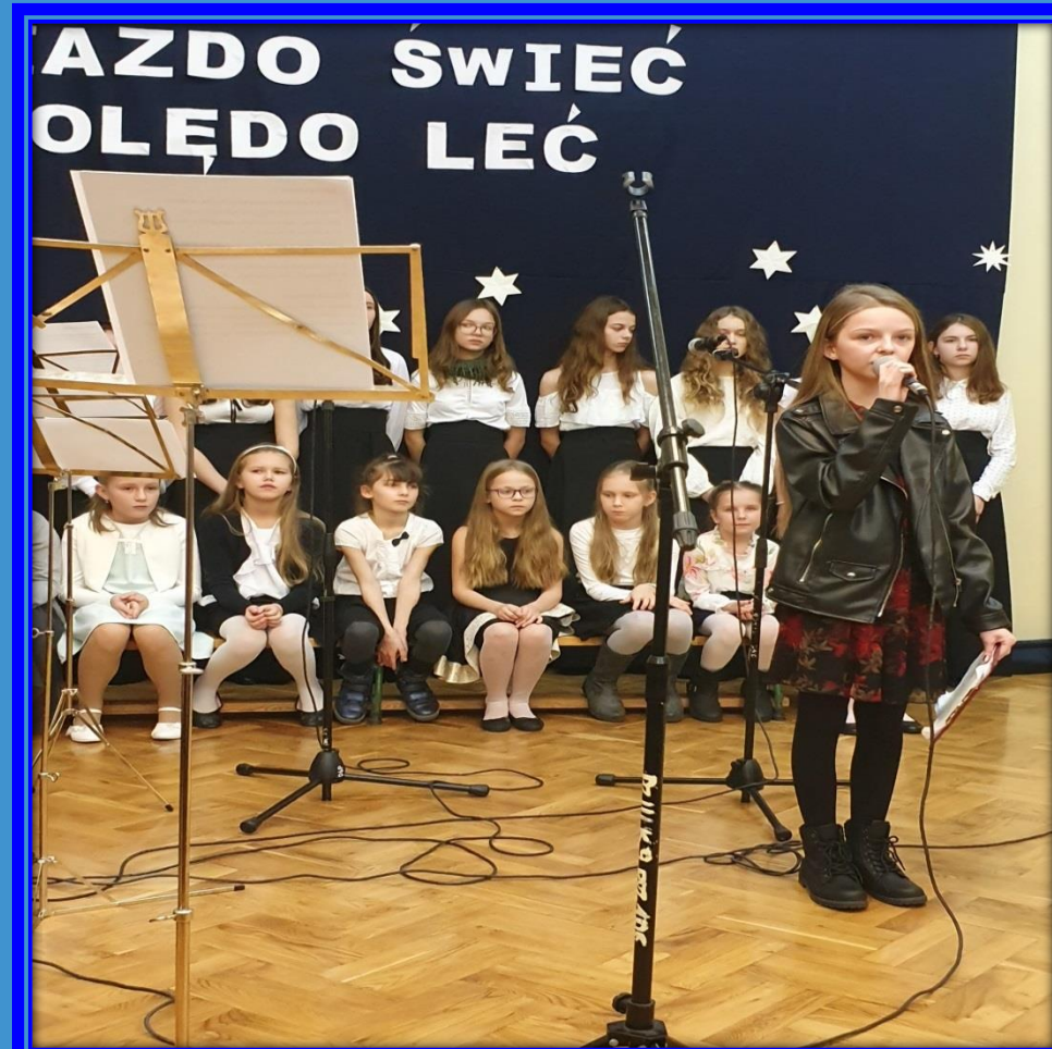
Występ zespołu „Przepióreczka” i chóru szkolnego.